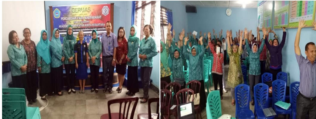
Gambar 2. Kegiatan penyuluhan kesehatan di Aula Kecamatan Siantar Martoba

(Hartati, 2021). Selanjutnya Wance (2021) mengatakan pemberdayaan merupakan suatu upaya memampukan serta memandirikan masyarakat untuk menolong dirinya sendiri.