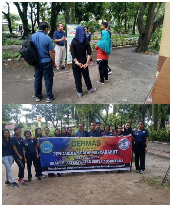
Gambar 3. Workshop perilaku hidup sehat di Lapangan umum