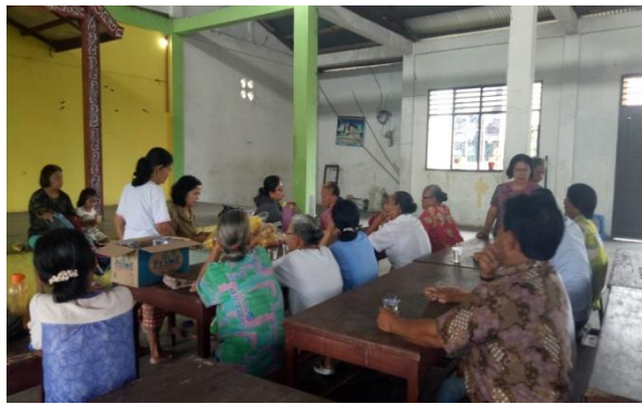
Gambar 4. Kegiatan penyuluhan kesehatan kepada Ibu-ibu PKK, dan para Lansia.