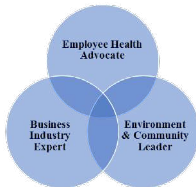
Gambar 6.1: Occupational Health Nursing Role (ABOHN, 2015)